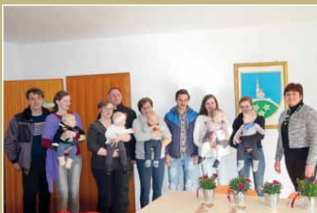
Sprejem novorojencev pri županji