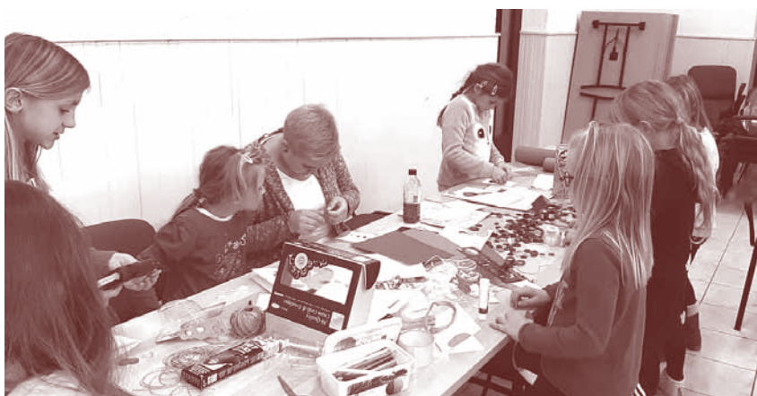
Delavnica z gasilskim podmladkom

Vsem športnim asom še enkrat čestitke, hvala za sodelovanje in še naprej dobre rezultate.