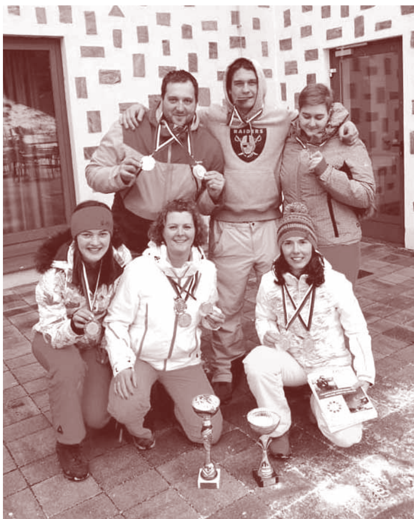
Uspešni na smučarskih tekmovanjih

Tudi odrasli se radi izobražujemo. Čeprav smo prijavljeni na tečaje, katere bi morali opraviti že spomladi,