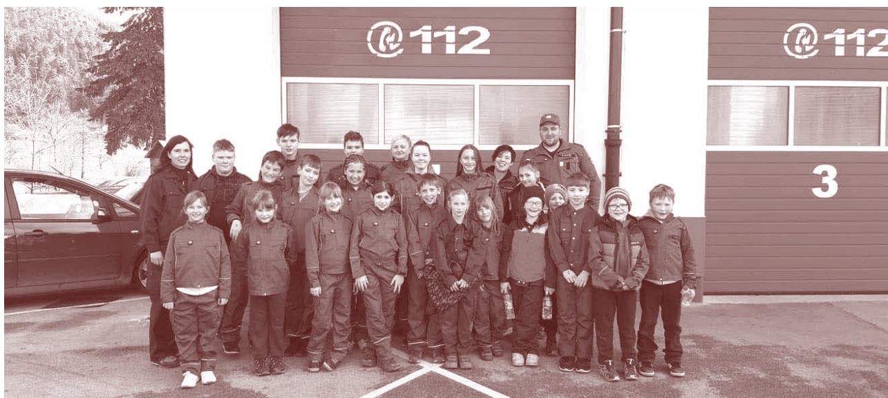
Mladi gasilci so sodelovali na kvizu.

Da solčavski gasilci nismo samo v vrhunski telesni pripravljenosti, ampak da smo vedno željni novega znanja, so letos dokazali naši najmlajši člani. Kar 5 ekip pionirjev in pionirk ter 2 ekipi mladincev in mladink se je v začetku marca udeležilo kviza mladine v Nazarjah in osvojili so odlična mesta.