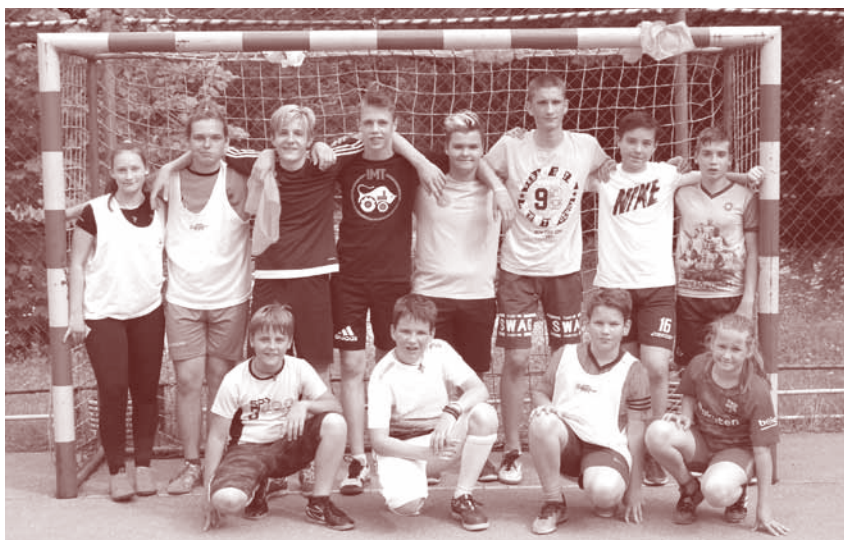
Otroški turnir v nogometu