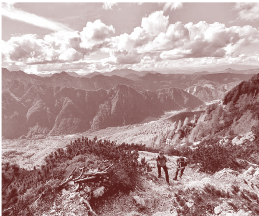
Urejanje poti na Krofičko