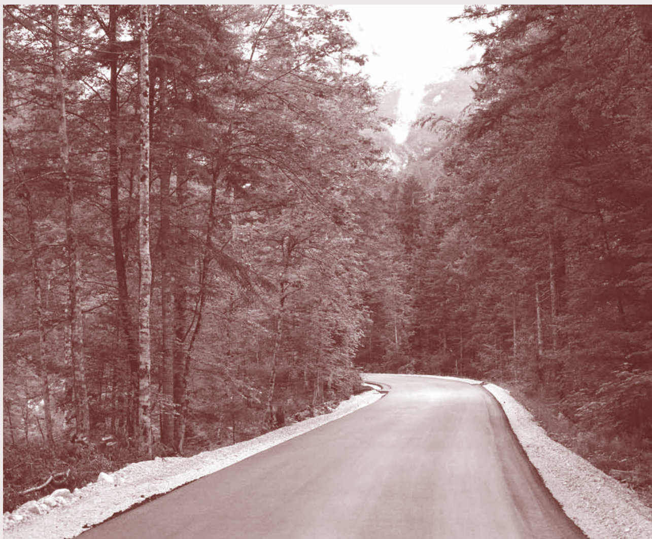
Preplastitev ceste do slapa Rinka

investicijskih in vzdrževalnih delih na državni in občinski cestni infrastrukturi, svetniki pa so postavili vprašanja o zbiranju silažne folije, poslovanju zdravstvenega doma Nazarje, občinski mali hidroelektrarni in o potrebi po umiritvi prometa na določenih odsekih državne ceste.