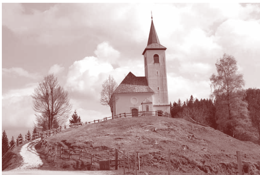
Cerkev Svetega Duha v Podolševi

se prav tako trudimo z uvedbo mehke mobilnosti in javnih prevozov ter s prepoznavanjem alpske destinacije na več tujih trgih. Želimo si združitve v formalno združenje, ki bo imelo možnost pridobitve kakšnih razvojnih sredstev in ki bo seveda še utrdilo namero županov šestih občin (Solčava, Luče, Jezersko, Preddvor, Cerklje na Gorenjskem in Kamnik), da sodelujemo v