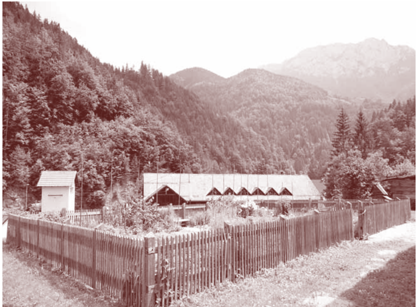
Urejena okolica je ogledalo kraja.

Kaže, da vsaj deloma vstopamo v poletno (tudi turistično) sezono. Občina se v okvirih pristojnosti in zmožnosti trudi kolikor toliko zadovoljivo urejati javne površine v kraju. Vabimo vas, da tudi sami poskrbite za okolico svojih domov, vključno s površinami v vaši neposredni bližini, ki (še) niso vaše (ker so občinske, župnijske ...), jih pa tako ali drugače uporabljate. V zadovoljstvo vseh in za dober vtis, ki ga bodo odnesli obiskovalci!