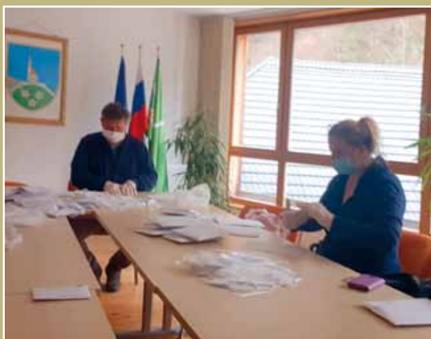
Pakiranje zaščitnih mask za občane