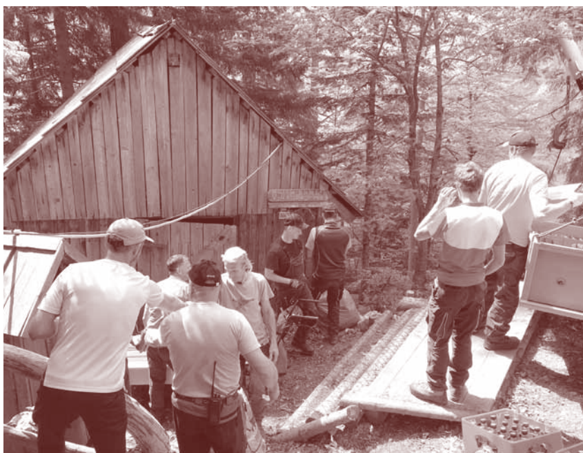
Planinci so pomagali pri čistilni akciji na Klemenči jami.

Za krepitev lokalnega planinskega duha bomo letos organizirali še tri družinske pohode po Solčavi. Prvi je pohod v Robanov kot julija, drugi na Grohot avgusta in tretji na Klemenčo jamo septembra. Točne datume bomo objavili sproti, zato nas spremljajte preko socialnih omrežij in obvestil na oglasnih deskah po Solčavi.