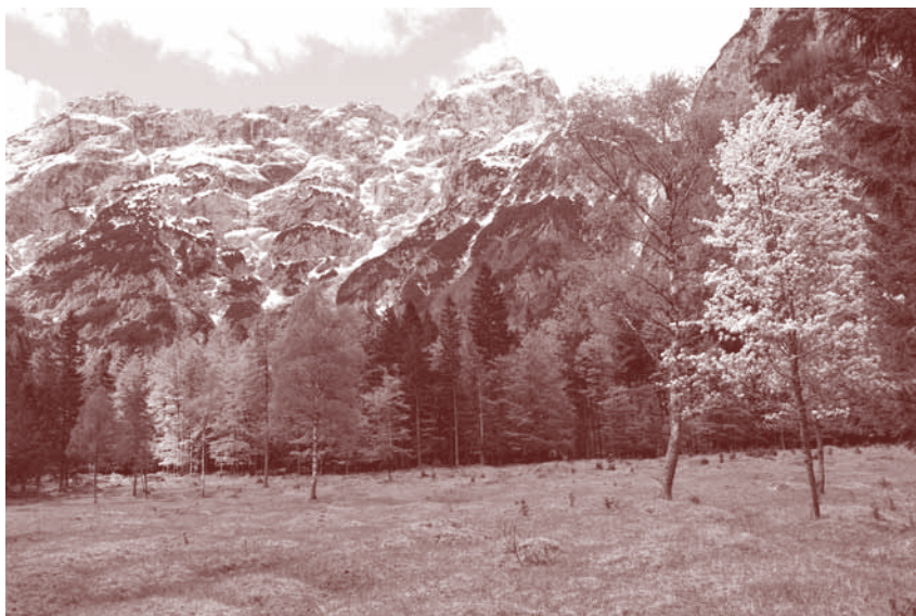
Pomlad v Robanovem kotu

Težki časi so nam dali tudi nov uvid v delovanje destinacije. Želimo si razvoja, pravičnega, zelenega, visoko kvalitetnega. Za to bomo potrebovali sredstva in želja je, da smo v tem uspešni in da lahko na račun razvoja turizma ustvarimo tudi kakšno novo delovno mesto. Poleti nas čaka izpopolnjevanje zelene sheme slovenskega turizma, kjer si želimo ob ponovni