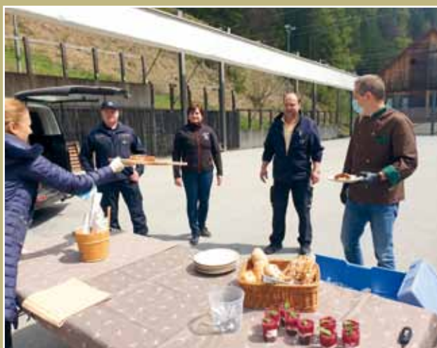
Članom Civilne zaščite so v času pandemije koronavirusa priskočili na pomoč domačini.