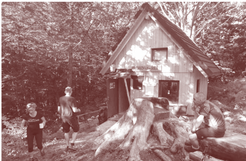
Začasni Frischaufov dom