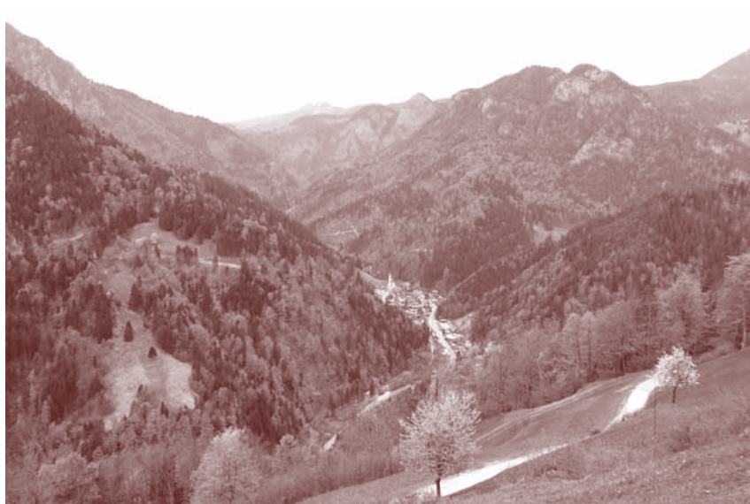
Pogled na Solčavsko iz Tolstega vrha