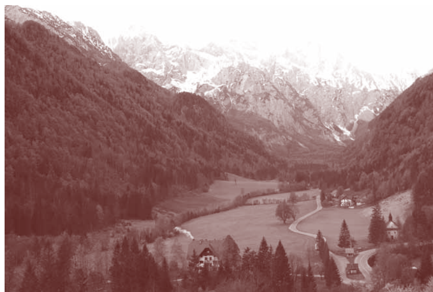
Logarska dolina, lepa v vsakem letnem času

Primerjava števila nočitev za prvih pet mesecev leta v obdobju 2019–2020