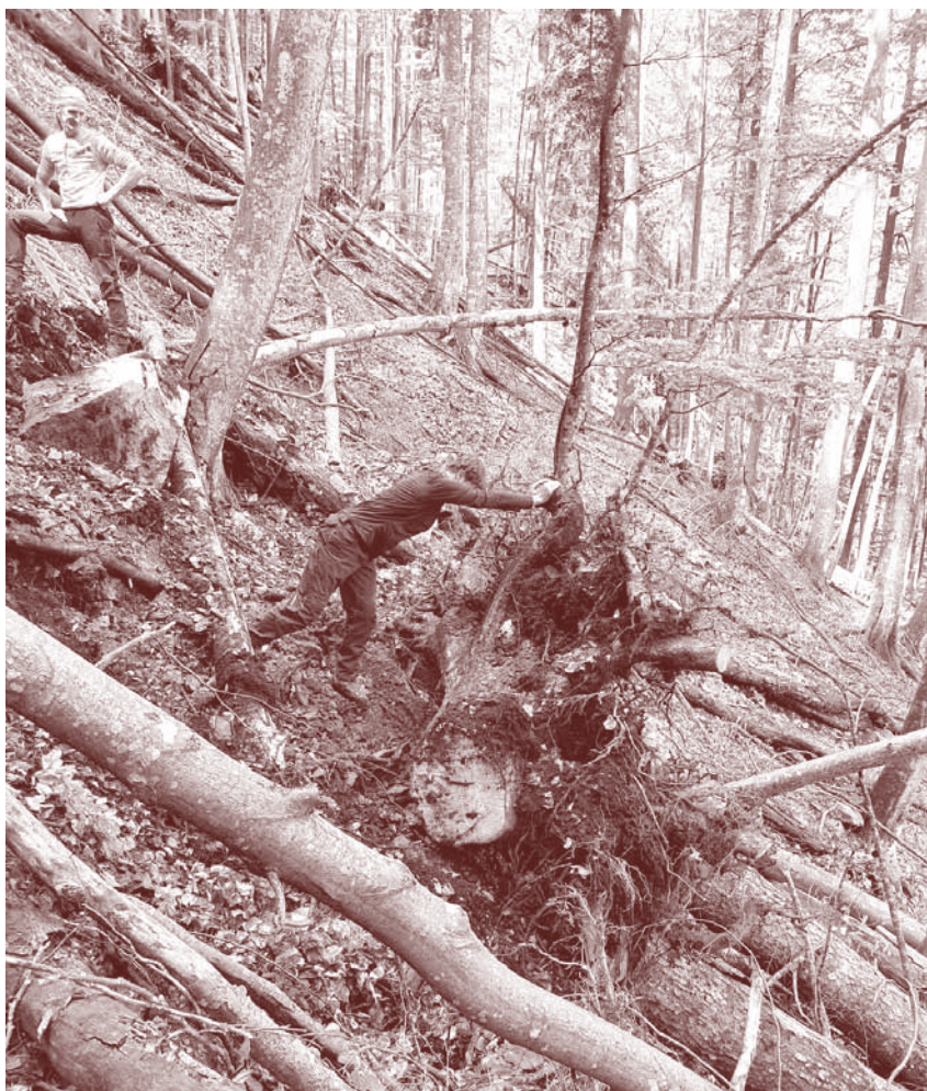
Odstranjevanje podrlih dreves na planinski poti