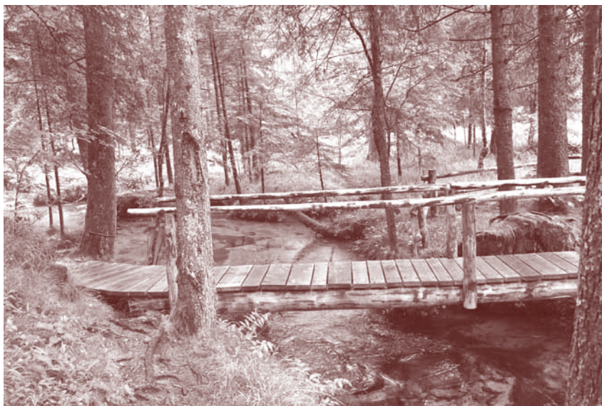
Urejanje infrastrukture v Krajinskem parku Logarska dolina

Člani odbora so po razpravi potrdili poročilo o delu za leto 2019 in se seznanili s predstavljenim osnutkom načrta dela in finančnega načrta za leto 2020. Županja je predstavila načrt investicij na področju javne in komunalne infrastrukture v parku, ravnanja z odpadki, pobiranja vstopnine in načrtovane obnove pešpoti. Menila je, da so načrti ambiciozni in da si želi, da z državo čim prej dosežemo dogovor glede bodočega upravljanja parka.