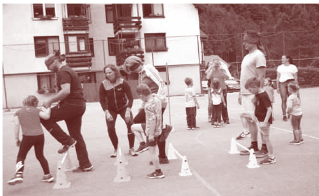
Športno popoldne za otroke in starše