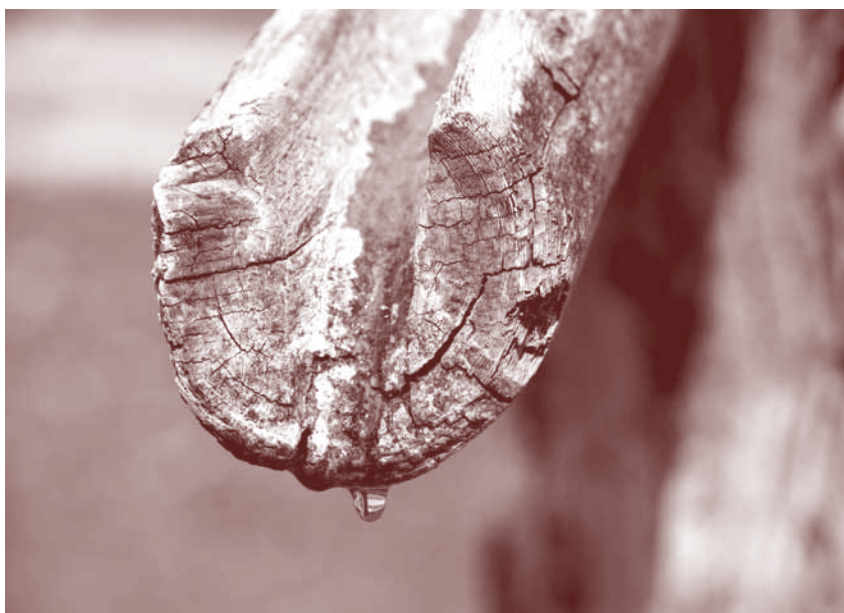
Vsaka kapljica šteje.

Pomembno je poudariti tudi, da moramo varčevati s pitno vodo, čeprav je imamo zaenkrat še v izobilju in se zdi tako samoumevna. Le nekaj odstotkov vode na zemlji je pitne in le nekaj odstotkov prebivalcev zemlje ima to srečo, da imajo možnost nemotene oskrbe z zdravo pitno vodo. Med njimi smo tudi mi. Zavedajmo se tega in varčujmo z njo pri vsakodnevnih opravilih.