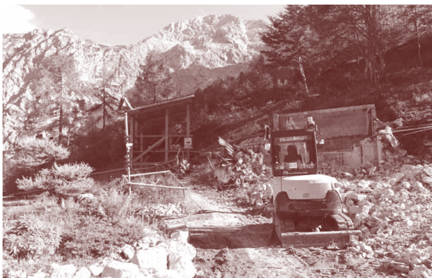
Odstranjevanje ruševin Frischaufovega doma