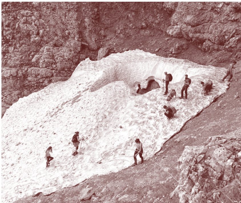
Pohod v Matkov škaf

Sredi junija smo ob pomoči markacistov PZS-ja obnovili pot na Krofičko. Člani društva smo si napolnili nahrbtnike in pod peči Krofičke odnesli nove kline in vrvi (»zajle«). Markacisti za zelo zahtevne poti so pot očistili in namestili nova varovala. Tako je zdaj pot urejena, predvsem pa varna za vse pohodnike.