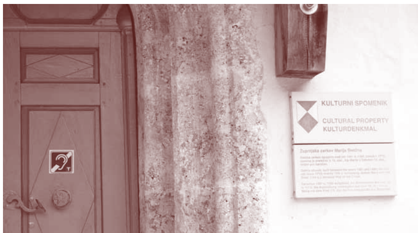
Slušna zanka v farni cerkvi

Obveščamo vas, da je Občina Solčava prenovila sistem zunanjšega ozvočenja pri farni cerkvi v Solčavi. Prav tako je obnovljen sistem slušne (indukcijske) zanke v farni cerkvi, ki uporabnikom slušnih aparatov omogoča nemoteno poslušanje izgovorjenega v mikrofoni.