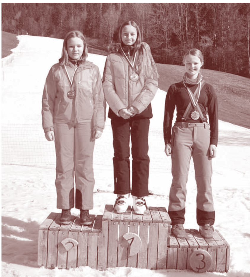
Na smučarskih tekmovanjih uspešne tudi mladinke

Vsak prispevek gre v dobro društvu in v dobro Solčavanom.