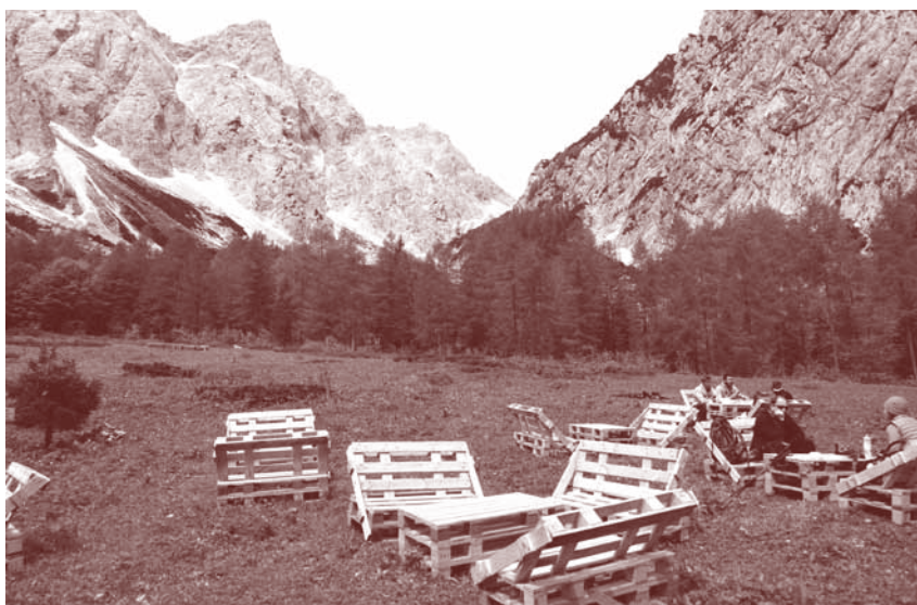
Planinci imajo na Okrešlju prostor za kratek počitek kar na travniku.

Okrešelj je amfiteatralna oaza, ki vsak mesec v letu ponuja drugačno in svojevrstno podobo planinskega raja. Je stičišče poti z visokih gora in izhodišče do vseh vrhov