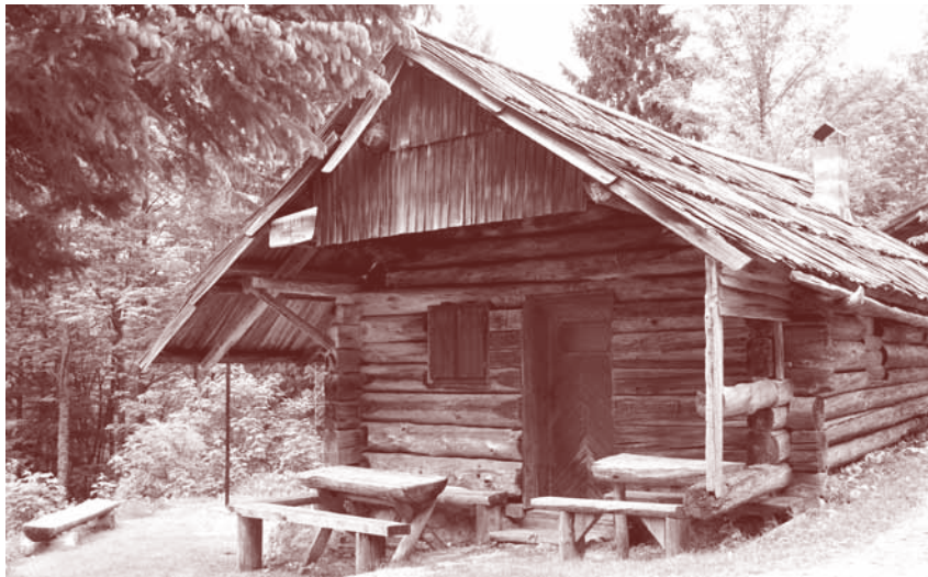
Najstarejša planinska postojanka v Sloveniji

Že naši predniki, gospodarji velikih samooskrbnih kmetij, lovci, pastirji, raziskovalci in tudi kar tako, iz ljubezni do sveta, ki nas obdaja ter želje po odkrivanju nečesa novega in spoznavanja lastnega življenjskega okolja, so že od nekdaj raziskovali gorski svet in življenje v dolinah pod njimi. Vse od poselitve teh krajev so gospodarji zemljo obdelovali in si jo kultivirali na način, ki je omogočal razmere za preživetje številnih družin. Oblikovali so krajino, s krčtivijo gozda so že v 15. in 16. stoletju nastajale zasebne planine tudi na višje ležečih pobočjih. V celotnem alpskem prostoru se je razvijalo planšarstvo. O razvoju planšarstva je pisal že Valvasor v 17. stoletju, pozneje, zlasti v prvi polovici