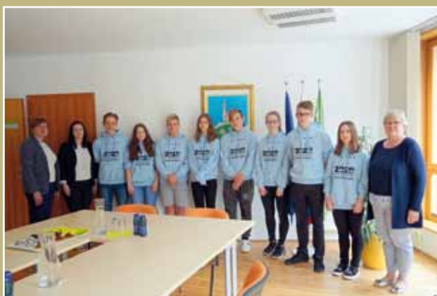
Sprejem devetošolcev pri županji