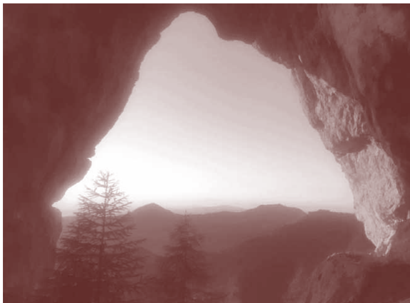
Lipševa vrata v Olševi

Večino poti smo hodili po gozdni stezi, proti koncu pa