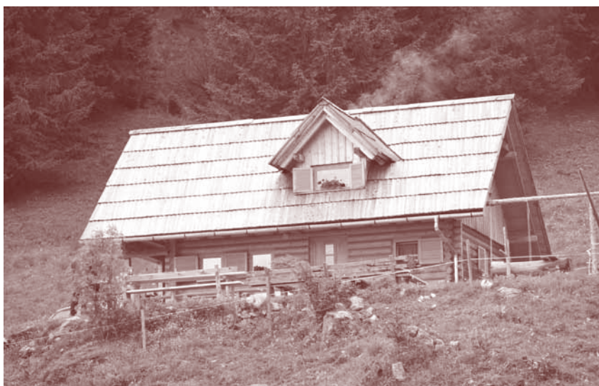
Pastirski stan na planinskem pašniku Grohot

Oskrba planinskih postojank je zahtevna naloga. Obsega veliko fizičnega dela, osebnih